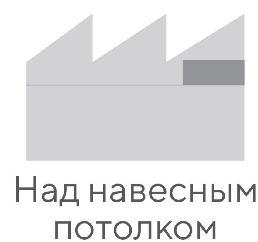
Над навесным потолком