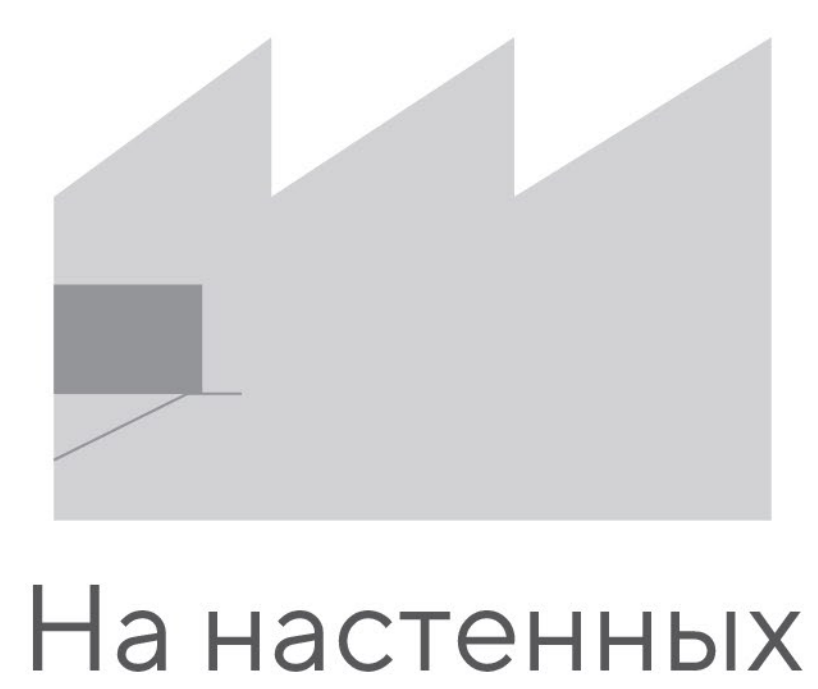
На настенных кронштейнах