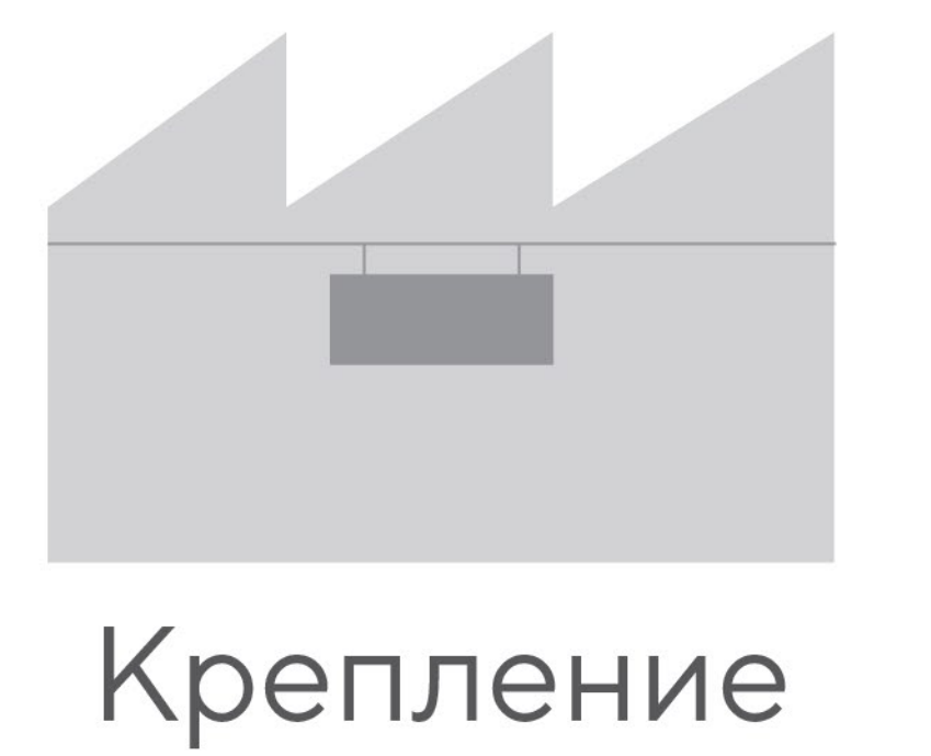
Крепление к потолку